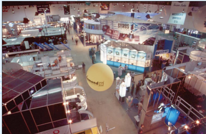
Уголок выставки “Связь-Экспокомм-98”.

действительно смотрю уникальных технологий, ноу-хау, а выставки в Москве — это всего лишь огромная ярмарка товаров и услуг связи. Пусть в известной мере это и так, но на 10-й международной выставке “Связь-Экспокомм-98” не было “залежалых” товаров. Скорее всего, наоборот — родившиеся когда-то на московских смотрах идеи и техника, в виде отдельных образцов, демонстрировались здесь в современных системах, готовых к внедрению в любых масштабах, лишь бы они опирались на прочный инвестиционный фундамент. А как свидетельствуют цифры, обнародованные на самой выставке, отечественная связь, хотя и широко использует иностранные инвестиции (только в области телефонии они выросли с 6 млн долл. в 1991 г. до 820 млн долл.